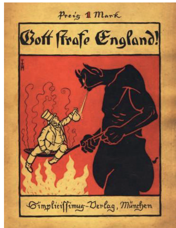
Gott strafe England! (Zeichnung von Thomas Theodor Heine)