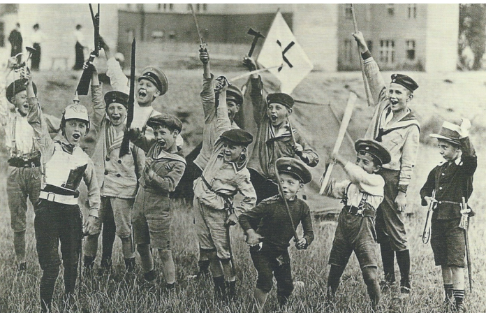
Kinder spielen Krieg