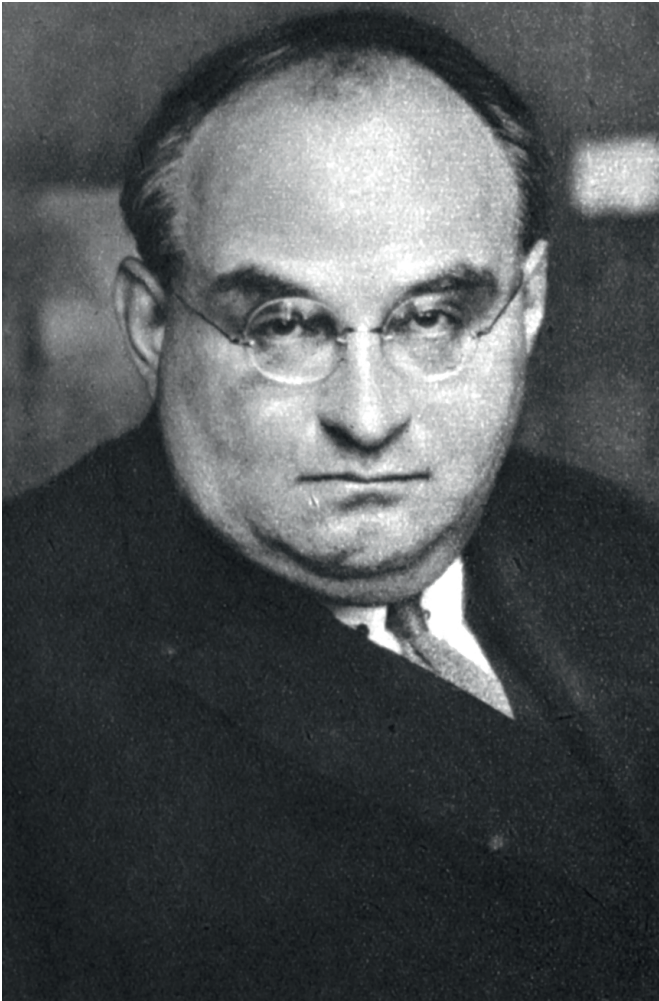
Ernst Lissauer*, Autor des »Haßgesangs gegen England«