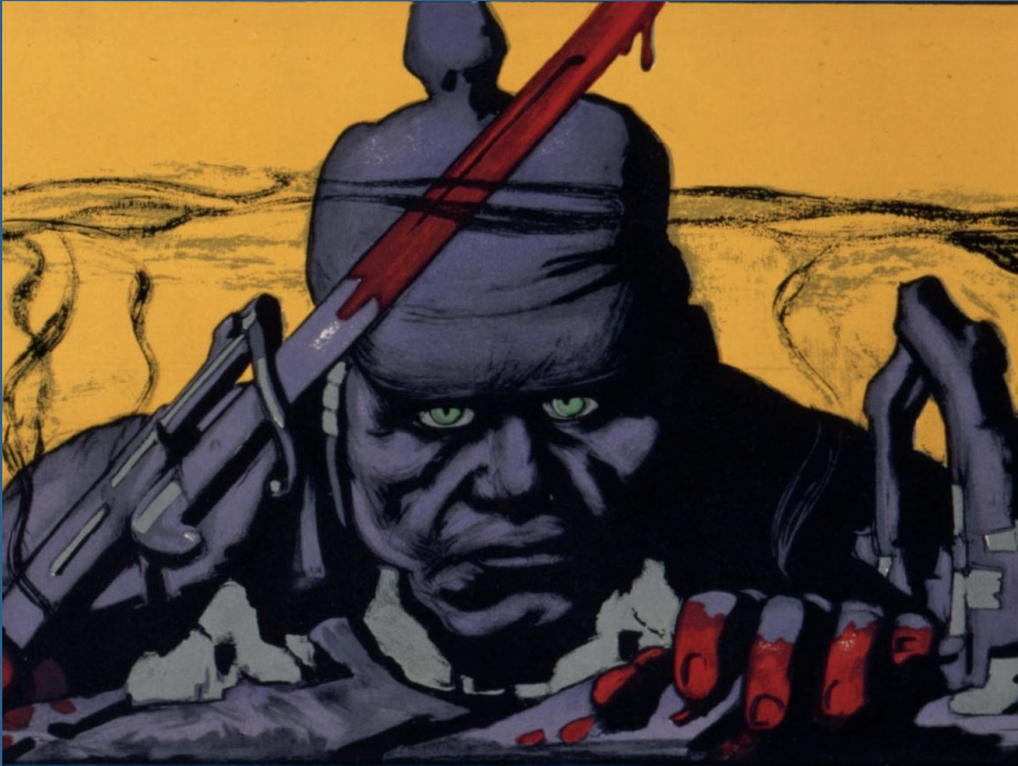
US-Propagandaplakat gegen Deutschland

Hinterland. Der Abonnent und der Patriot im Gespräch: Die Knebelung der öffentlichen Meinung.