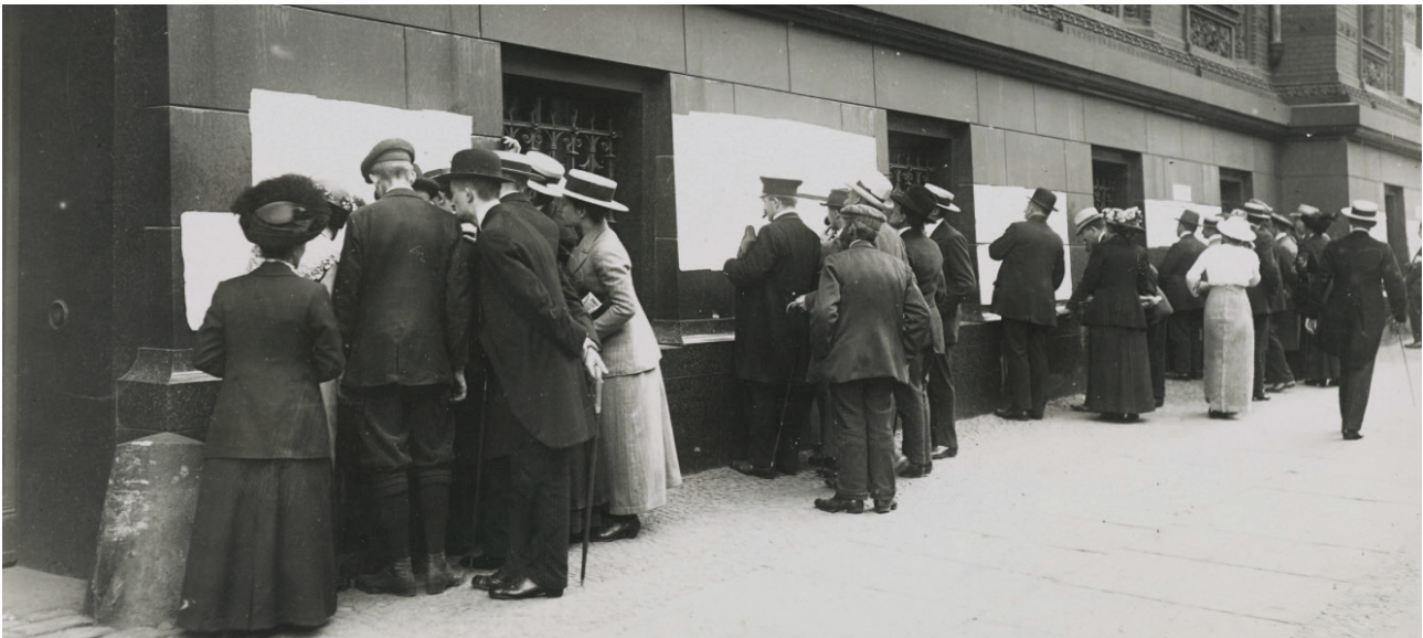
Passanten lesen die Verlustlisten für Österreich-Ungarn über Getötete, Verwundete, Verletzte, Vermisste, Gefangene (1916)