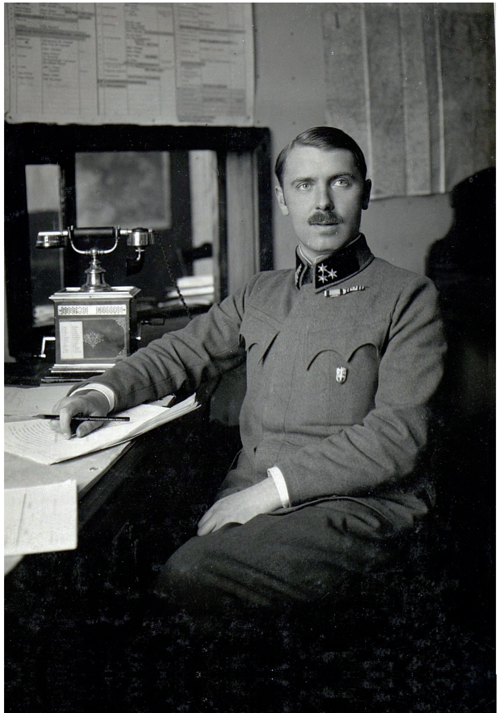
Hauptmann an seinem Schreibtisch im Kriegsministerium: »Alstern was wolln S' denn noch? Wir können doch net wissen, ob einer tot is oder verwundet in Gefangenschaft geraten?«