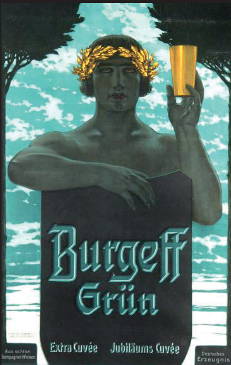
Sekt Burggeff Grün