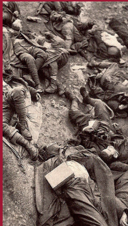
Tote in Hunger und Dreck