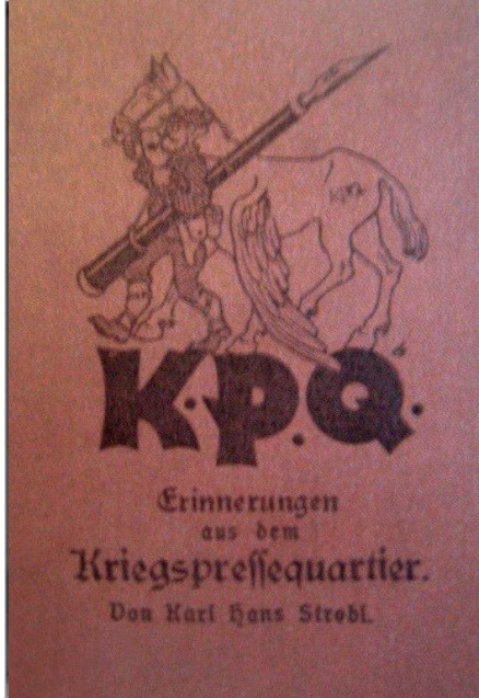
Strobl: »Erinnerungen aus dem Kriegspressequartier«