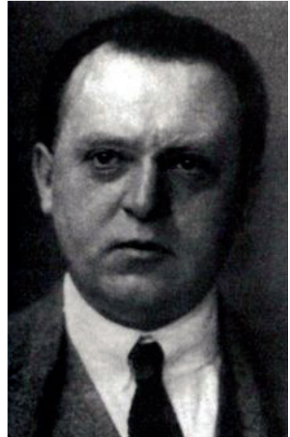
Karl Hans Strobl*