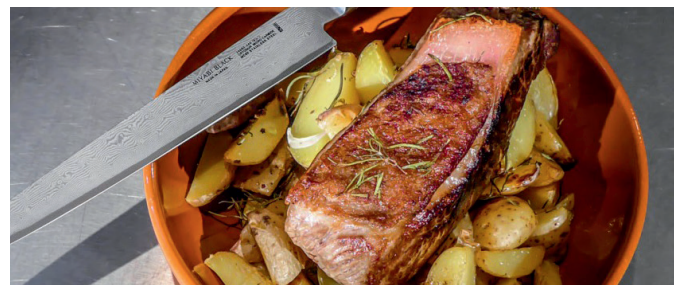
Geselchtes mit Messer