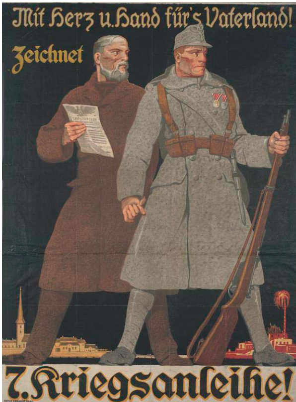
Plakat für die 7. Kriegsanleihe