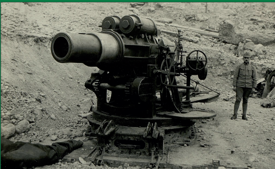
30.5 cm Mörser in Feuerstellung

DER ÖSTERREICHISCH-UNGARISCHE 30,5 CM MÖRSER in den Ausführungen M.11, M.11/16 und M.16 System Skoda zählte zu den modernsten Belagerungsgeschützen seiner Zeit und bildete das Rückgrat der k. u. k. Belagerungsartillerie. Während des Ersten Weltkrieges bewährte sich der Mörser an allen Kriegsschauplätzen, er kam sogar an der deutschen Westfront zum Einsatz und wurde mehrfach modifiziert. Insgesamt lieferten die Skoda-Werke 101 Mörser an die k. u. k. Armee.